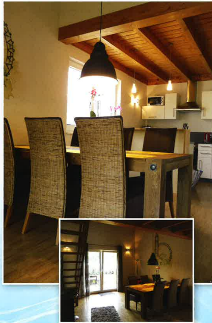
URLAUBSwelt: Gewohnte Novasol-Qualität und Komfort

parkscout|plus: Neben der oben erwähnten Erweiterung sind es für die jungen Besucher vor allem die neuen Rutschen, die für