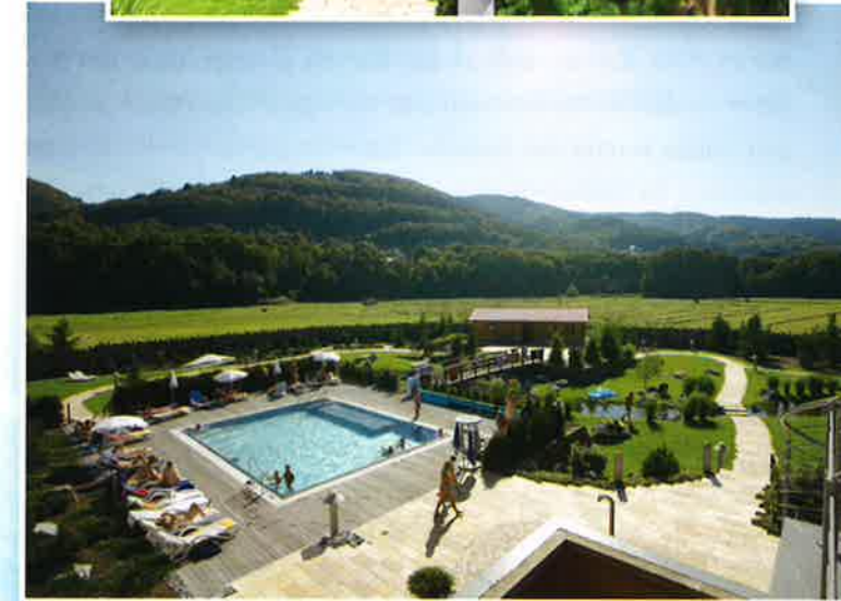
Vielfältige SAUNAwelt (o.) RELAXwelt mit der SaLounge und dem Wärmebad (u.)