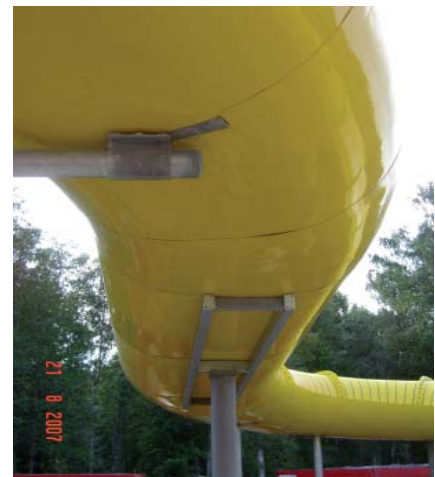
Magic Eye® Avesta

Erstmals haben wir die neue Dämmung für unsere Wasserrutsche Magic Eye® im Thermal-Badehaus in Avesta (Schweden) eingesetzt. Das Magic Eye® weist eine vollständige Wärmedämmung der Unterschale auf. Dies trägt erheblich zur Einsparung von Energie und einem schönen Äusseren bei.