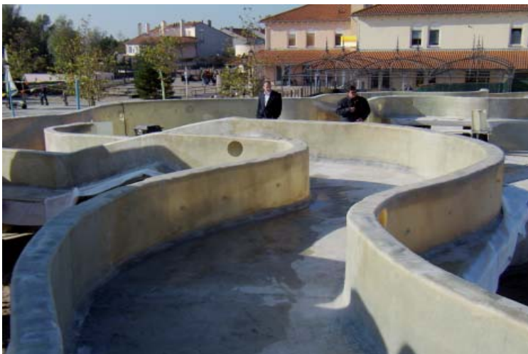
Montage Center Parcs, Port Zélande

Mit einem neuen System aus GFK-Elementen ist es gelungen, den Verlauf des Flusses völlig frei nach dem Wunsch des Kunden zu gestalten.