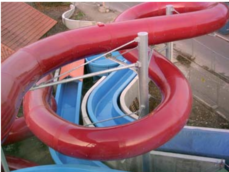
Röhrenrutsche mit Aussenhülle und Widwasserfluss Weil am Rhein

Durch ein ausgeklügeltes System mit einer Aussenhülle und wasserunempfindlichem Wärmedämmmaterial zwischen Rutschenelement und Hülle ist es gelungen, den K-Wert einer Röhrenrutsche von normal 5,10 W/m 2 K auf ca. 0,49 W/m 2 K zu senken. Die so verkleidete Rutsche weist darüber hinaus nach aussen hin keine Fläche mehr auf und die Aussenfläche zeigt sich glatt und hochglänzend . Durch die abnehmbare Aussenhülle wird die problemlose Wartung an notwendigen Punkten, z.B. für Lichteffekte ermöglicht.