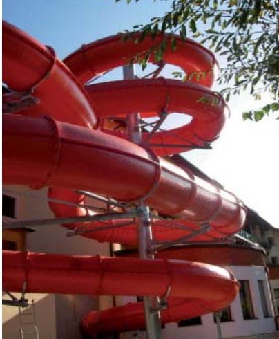
Röhrenrutsche Hotel Mozart Ried

Immer mehr Betreiber der in Österreich verbreiteten Kinderhotels zeigen Interesse an den Wasserrutschen system klarer. Eine 120m lange Röhrenrutsche konnte soeben für das Hotel Mozart Ried / AT fertiggestellt werden.